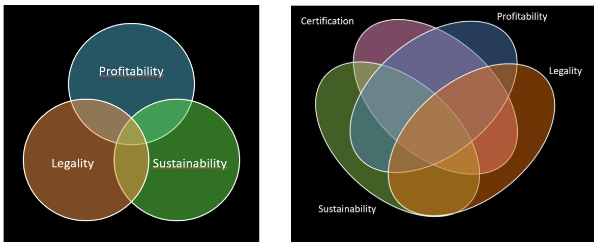
Figure 2 : Espaces des solutions à 3 dimensions (profitabilité, légalité, durabilité) et à 4 dimensions (certification). La combinatoire explique comment les cas de figure possibles se multiplient. Garder ce schéma en tête peut éviter des quiproquos.

Il faut donc s'armer d'outils pour ne pas se noyer dans cette complexité – comme les comptables ont développé des abaques. Partager ce genre de grilles de lecture peut apporter plus de clarté dans les débats que vous souhaitez tenir ».