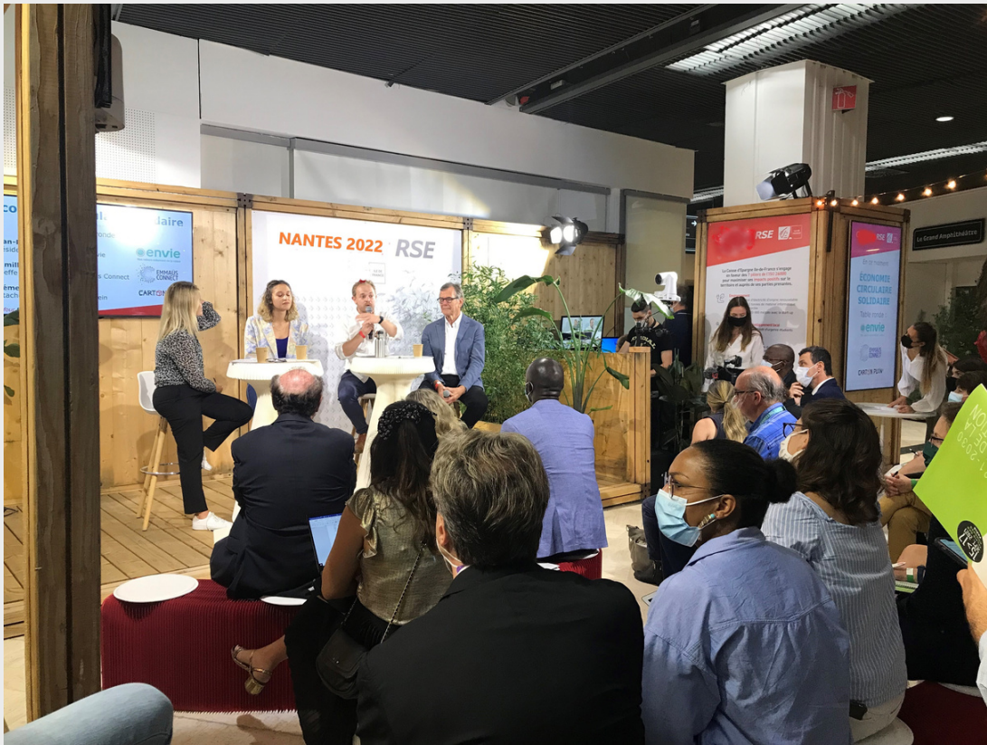
Rencontres sur espace agora