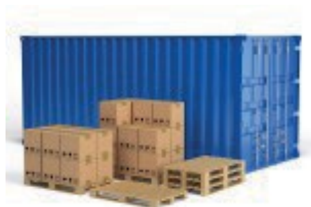
Peso total de la mercancía, incluyendo el embalaje y la tara del contenedor