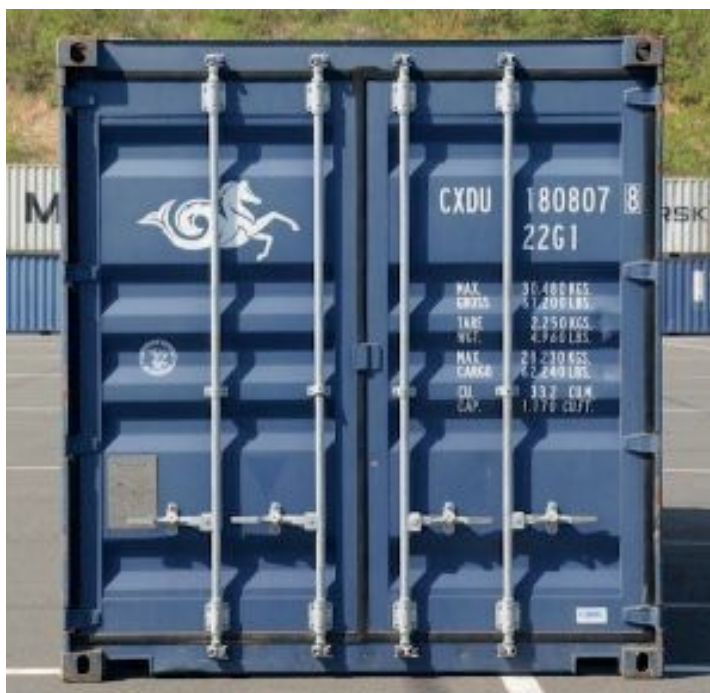
Codificación en un contenedor

El contenedor y su propietario se identifican mediante el código propuesto por la Oficina Internacional de Contenedores en 1969 y normalizado por la ISO en 1972.