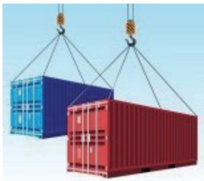
Peso real del contenedor, incluida la tara, cuando la mercancía está embalada