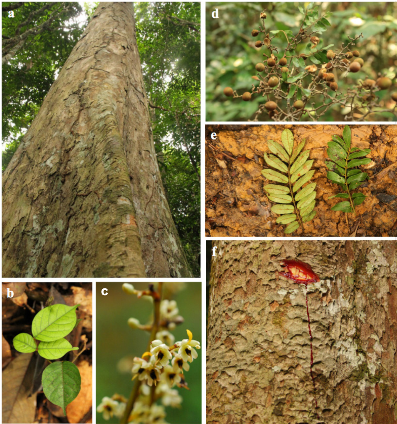
Figure 2. Partie de (a) fût, (b) plantule et (f) tranche exsudant un liquide poisseux rougeâtre de Dialium lopense ; (c) fleurs de Dialium cf. polyanthum ; (d) fruits et (e) feuilles de Dialium dinklagei — (a) trunk, (b) plant and (f) slash exuding a sticky reddish liquid of Dialium lopense ; (c) flowers of Dialium cf. polyanthum ; (d) fruits and (e) leaves of Dialium dinklagei .