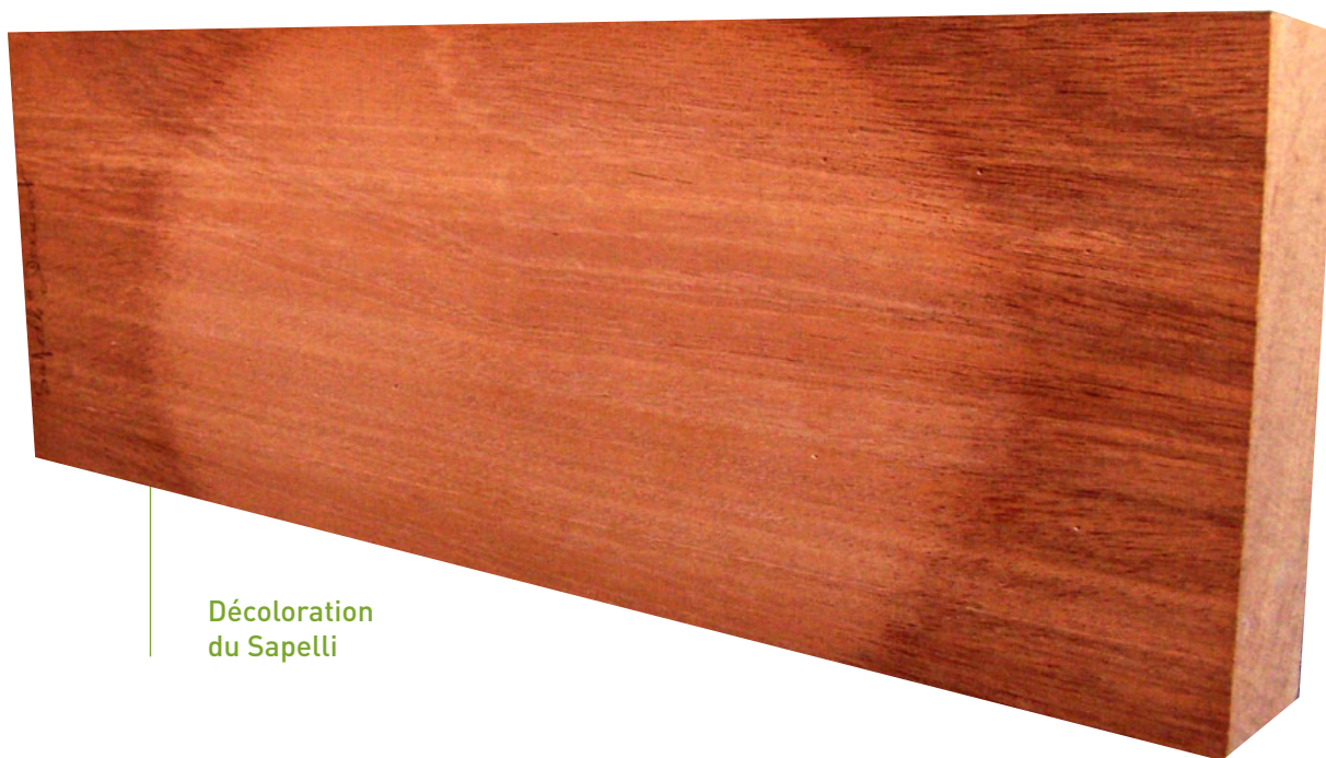
Décoloration du Sapelli