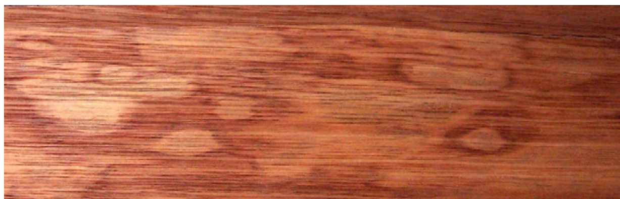
Taches sur du Bossé