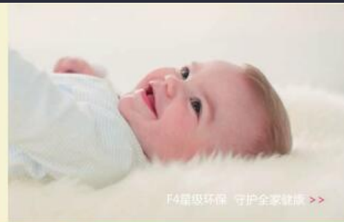
F4星级环保 守护全家健康 >>>