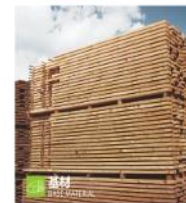
基材 RAW MATERIAL