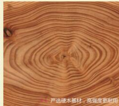
严选硬木基材，高强度更耐用