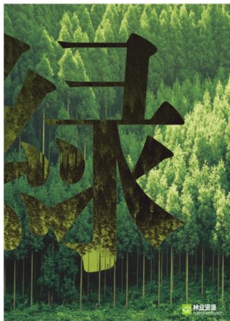
林业资源 FORESTRY RESOURCES