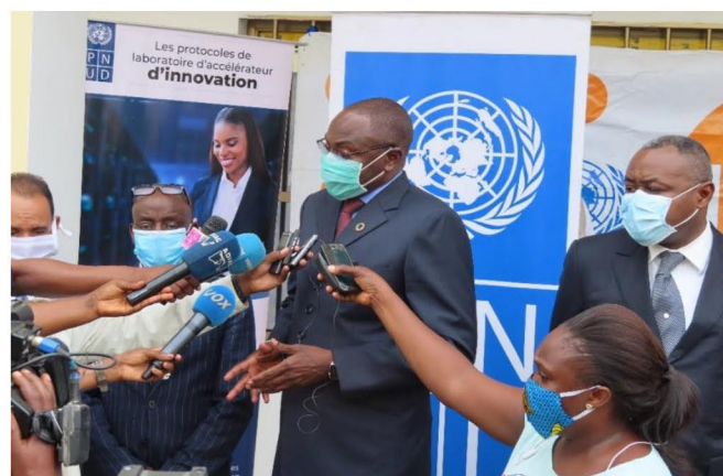
Le Représentant du PNUD face à la presse en présence du Coordonnateur Résident des Nations Unies et du Représentant de l'UNFPA.

Ces applications ont pour objectif de fournir instantanément aux utilisateurs des informations claires et détaillées sur ce qu'est la Covid-19, les moyens de s'en protéger, et de le diagnostiquer. Ce sont également des plateformes de relais d'informations en temps réel et notifications de rappels des mesures barrières. Ces solutions numériques dynamiques, simples, dotées d'interfaces conviviales pouvant prendre en compte d'autres langues nationales ont toutes été développées par des jeunes Congolais dont les talents et la créativité ont su être valorisés par les agences du Système des Nations Unies en République du Congo./-