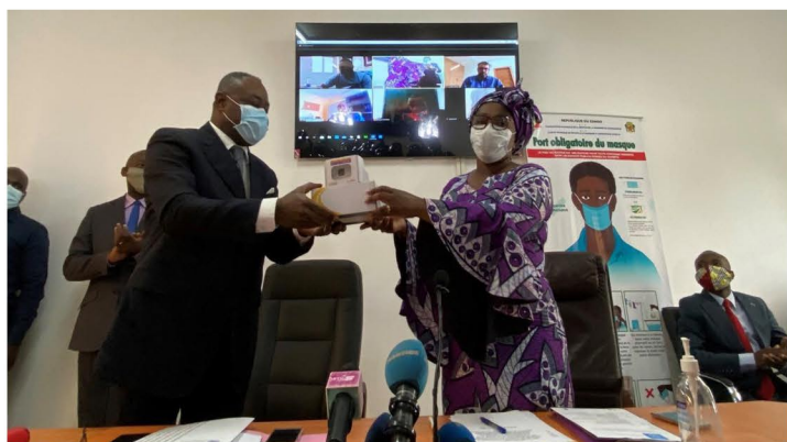
La Ministre de la Santé reçoit un échantillon de son collègue le Ministre de l'Economie numérique

Dans le cadre de son appui à la réponse nationale à la pandémie COVID-19 le Système des Nations Unies accompagne le Gouvernement de la République du Congo, dans l'exploitation des nouvelles technologies et des solutions digitales pour assurer la continuité du service public et améliorer la communication, la sensibilisation et la dissémination des informations relatives à la lutte contre la pandémie.