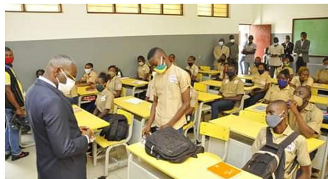
Le Ministre de l'Enseignement Primaire et Secondaire dans une salle de classe du retour du confinement

Après quarante-six jours de confinement, la reprise des cours a été effective pour les classes d'examen, ce 02 juin 2020 tel que décidé par le Gouvernement. L'UNESCO qui a appuyé le Ministère de l'Enseignement Primaire, Secondaire et de l'Alphabétisation dans la poursuite des apprentissages à domicile, était aux côtés du Ministre M. Anatole Collinet MAKOSSO, pour constater le retour à l'école des élèves dans quelques établissements de la capitale. Le protocole sanitaire a été respecté dans ces établissements, à la satisfaction de la communauté éducative et des parents. Durant six semaines, les enseignants ne ménageront aucun effort pour couvrir les volumes horaires prévus avant les épreuves d'Etat. Cette course à la montre est facilitée par la dotation des cours photocopiés aux élèves durant le confinement./-