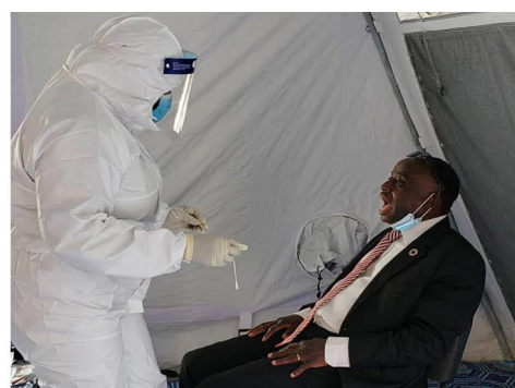
Le Coordonnateur Résident lors de son test volontaire de COVID19