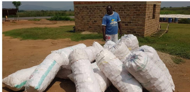
Sacs de Fufous des producteurs de la Bouenza en attente d'être évacués