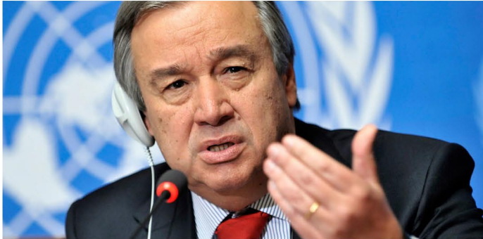
Antonio Guterres, Secrétaire Général des Nations Unies

A lors que le COVID-19 se propage sur le continent, l'Afrique a rapidement réagi face à la pandémie et, à ce jour, le nombre de cas signalés est plus faible que ce que l'on craignait. Malgré cela, l'enjeu reste de taille.