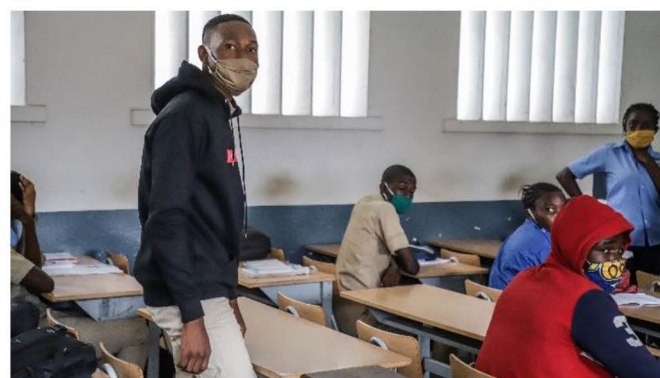
Les classes ont été réorganisées pour respecter les mesures de distanciation sociale et autres mesures de prévention.